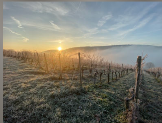
Stand Januar 2025